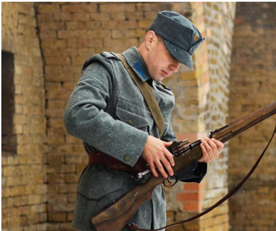
Стрілець Української галицької армії (1918 рік)

Закінчився Перший зимовий похід 6 травня 1920 року, коли частини ДА біля с. Писарівка Ямпільського повіту зустрілися з розвідувальними роз'їздами 2-ї стрілецької дивізії полковника Олександра Удовиченка, яка діяла у складі 6-ї польської армії. З цього приводу в рапорті Удовиченка Петлюрі читаємо: Повсюди лунає гучний козацький поклик “Слава Україні й Головному Отамані Петлюрі, слава отаману Омеляновичу-Павленку, усій старшині й козацтву славної Дієвої армії!” Того ж дня 6 травня відділи 3-ї польської армії увійшли в Київ, а вже 8 травня у Києві відбувся спільний парад польських частин і української 6-ї дивізії полковника Марка Безручка. На момент зустрічі Дієвої армії з українськими частинами, які вели наступ разом із поляками, її чисельність складала 4 319 чоловік при 81-му кулеметі та 12-ти гарматах.