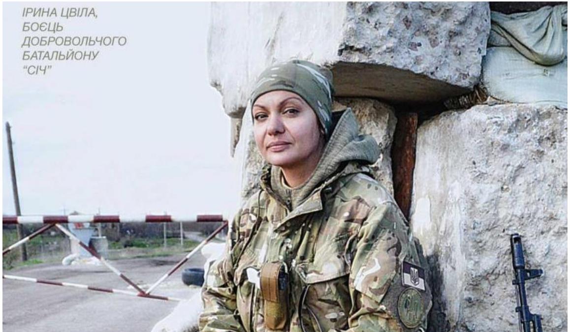
Вояк добровольчого батальйону (2014-2016 роки)

ЗС України були значно послаблені через багаторічне недофінансування, відсутність позитивних реформ і виявились нездатними до швидкого та ефективного захисту держави. Цю функцію на початковій стадії війни взяли на себе добровольчі батальйони. Їх основу склали учасники Революції Гідності та інші патріотично налаштовані громадяни, які відчували потребу негайної реакції на розв'язання РФ гібридної війни проти України.