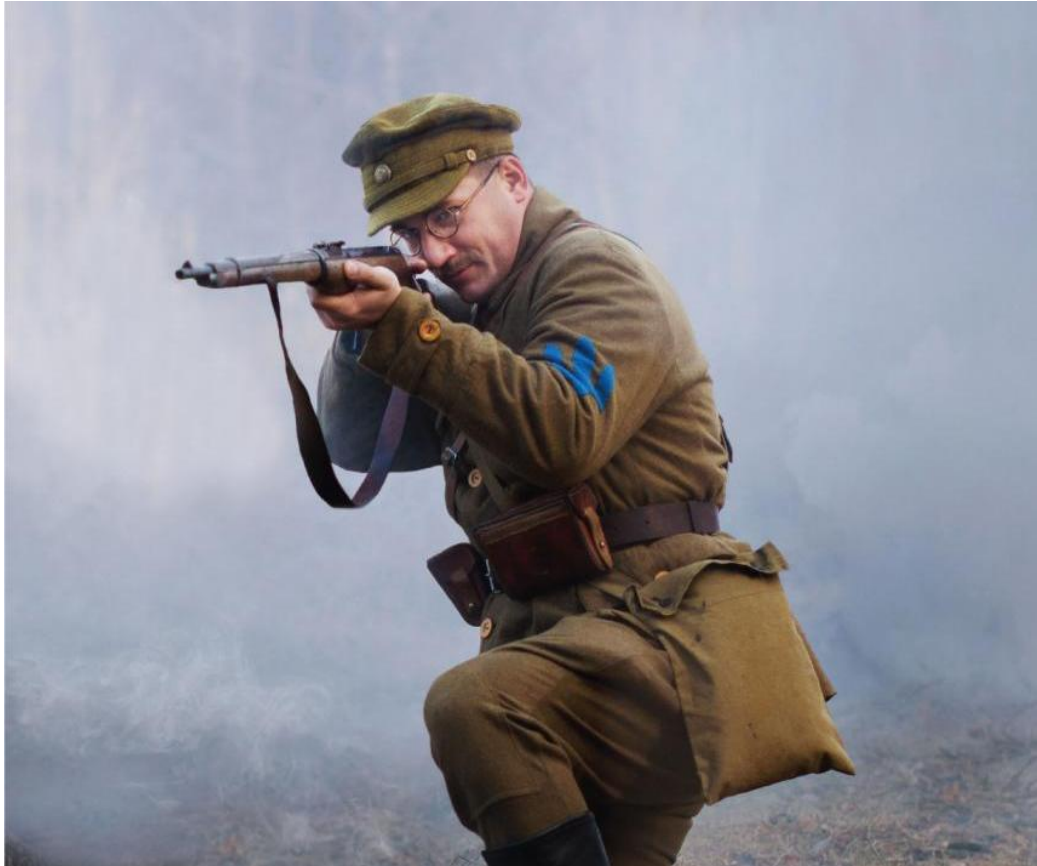
Козак Дієвої Армії УНР (1919 рік)